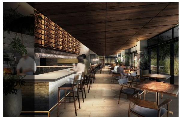
レストランイメージ