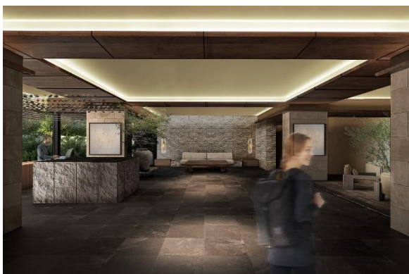
ラウンジイメージ

本物件では、環境への負荷低減を目指し、屋上に太陽光パネルを設置し建物共用部の電力を賄うほか、電気自動車の充電スタンド設置や現地石材の再利用、自然と一体化した温浴空間を設置するなど、景観・環境に配慮した計画となっています。