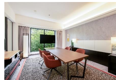
ご契約者様専用ミーティングルーム

【設備】インターネット環境 / TVモニター / Web会議用カメラ / マイクスピーカー