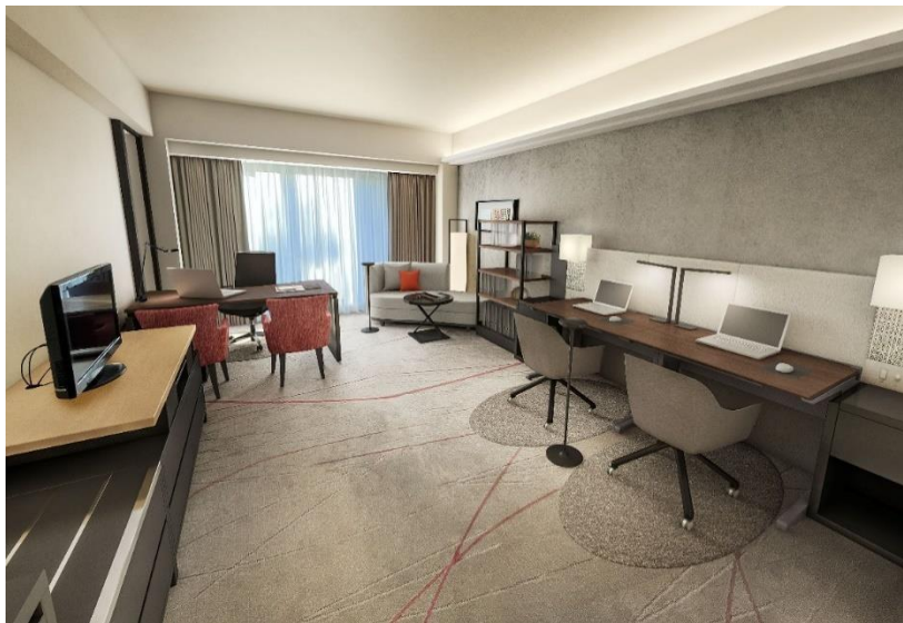
オフィス（イメージ）

このオフィスは専有部の他に契約者専用の共有ラウンジとミーティングルームを同フロアに併設し、フロントやコンシェルジュのサービスをはじめ、プールやフィットネス、駐車場のご利用、宿泊やレストラン、ルームサービスのご優待など、ホテルならではの様々なサービスをご利用いただけます。本事業を通じて、アフターコロナのお客様の新たなワークスタイルをご提供していきたいと考えております。