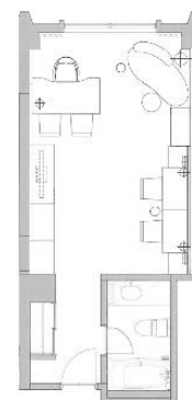
サービスオフィス (36㎡)