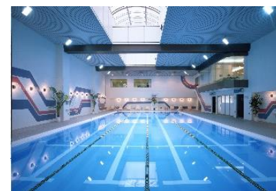
都ヘルスクラブ プール