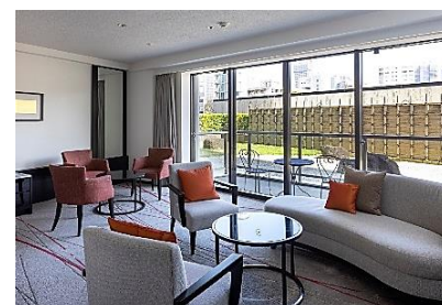
ご契約者様専用ラウンジ